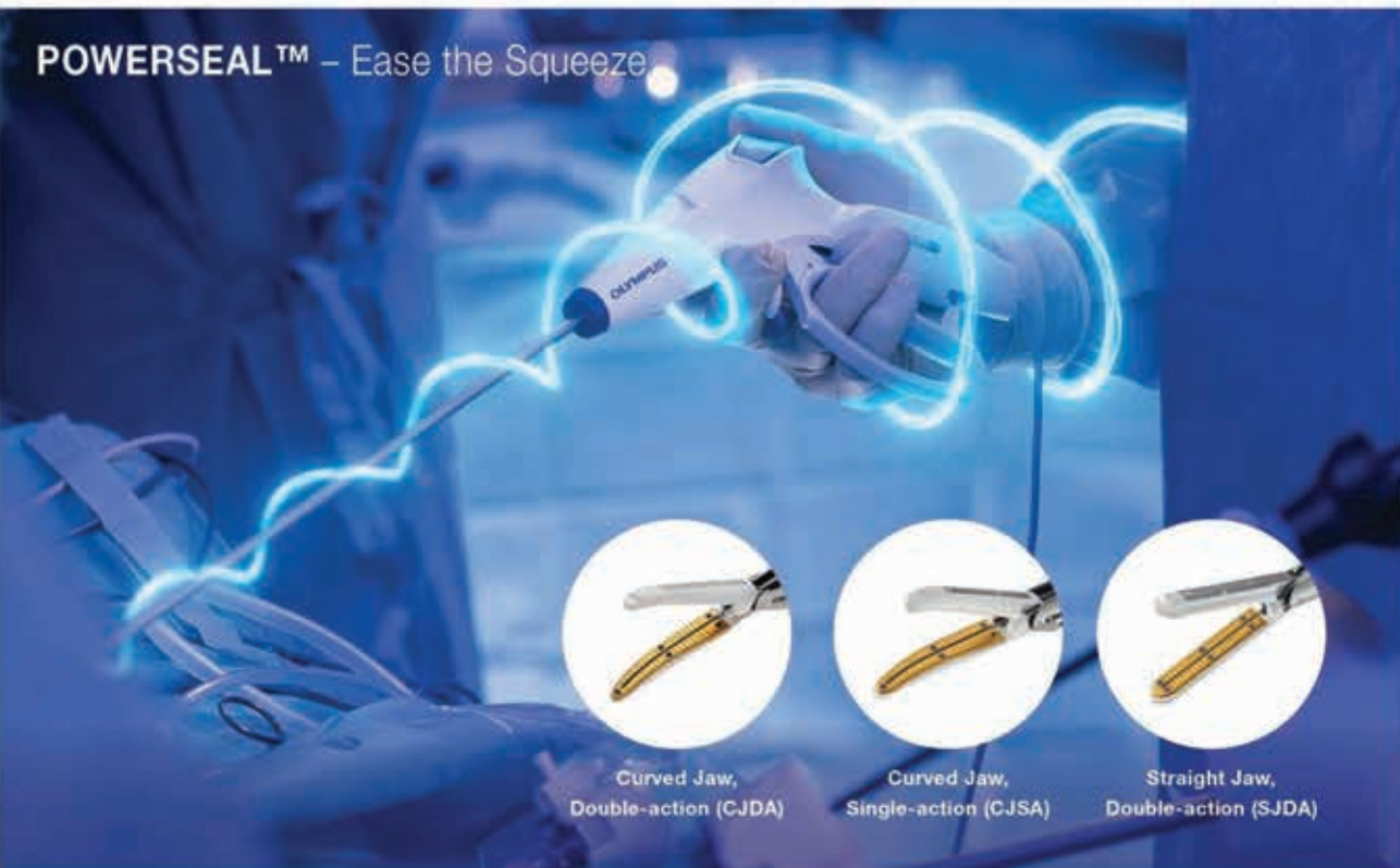
Curved Jaw, Double-action (CJDA)